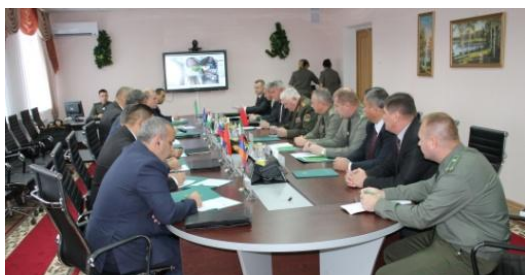
Рабочая встреча заместителей руководителей пограничных ведомств по вооружению и тылу, 23 –25 августа, г. Минск

Кроме того, Советом командующих образовано 5 временных рабочих органов, деятельность которых способствует повышению качества и эффективности его работы: Рабочая группа по выработке совместных мер борьбы с преступностью, незаконным оборотом наркотических средств, психотропных веществ и их прекурсоров, терроризмом и иными насильственными проявлениями экстремизма, незаконной миграцией; Координационный научный совет при СКПВ; Совет по сотрудничеству пограничных ведомств государств – участников СНГ в сфере культуры и ветеранской работы; Спортивный комитет пограничных ведомств государств – участников СНГ; Группа СКПВ по мониторингу и анализу ситуации на внешних границах государств – участников СНГ.