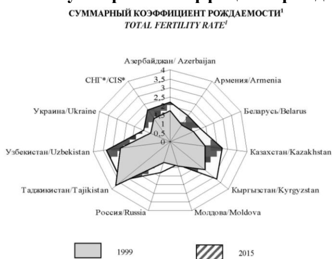
Рисунок 2. Суммарный коэффициент рождаемости

Оценивая первые результаты выполнения положений принятых документов в области семейной политики, следует отметить, что в государствах Содружества за короткий период увеличилась рождаемость, снизилось количество разводов, возросли коэффициенты суммарной рождаемости, что указывает на положительное их влияние на демографические показатели.